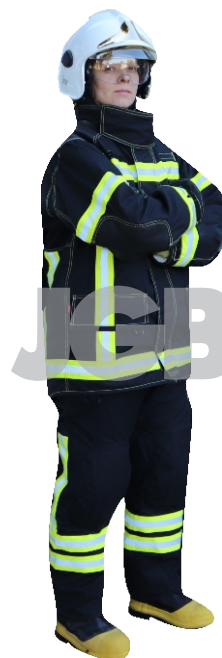
Imagen y color meramente ilustrativos. La JGB se designa en el derecho de modificar cualquier información de esta especificación técnica sin previo aviso.