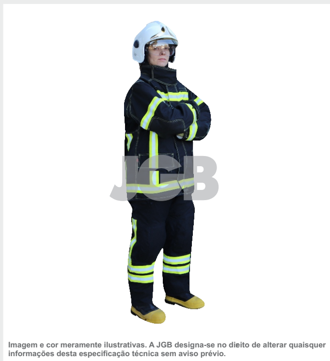
Imagem e cor meramente ilustrativas. A JGB designa-se no direito de alterar quaisquer informações desta especificação técnica sem aviso prévio.