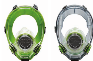
Máscaras completas BLS 5700 - BLS 5600