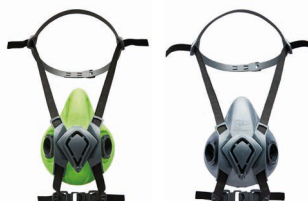
Medias máscaras BLS 4000 neXt S - BLS 4000 neXt R