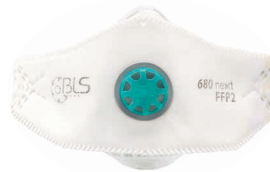
BLS 680ne»xt Talla M/L - Talla S