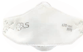
BLS 670ne»xt Talla M/L - Talla S